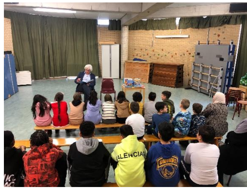
Op de Haagse Meester Schabergschool las de directeur van Nieuwspoor met verve voor.