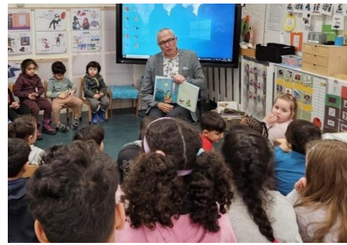
Op de Taalschool Leeuwarden zijn ze ingenomen met de Scholenschenking. (Foto links) en bij de Weidebloesem in Hogeveen ook. (Foto rechts)