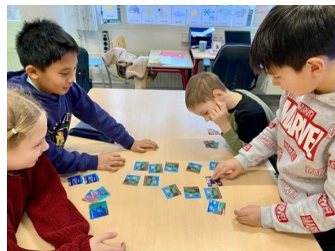
Op de Bataviaschool in Amsterdam Oost gingen ze meteen zelf aan het lezen en keken ze hoe goed ze met Kat Kaat is weg Memory waren.